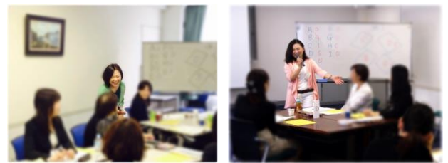
<過去のセミナー時の様子>